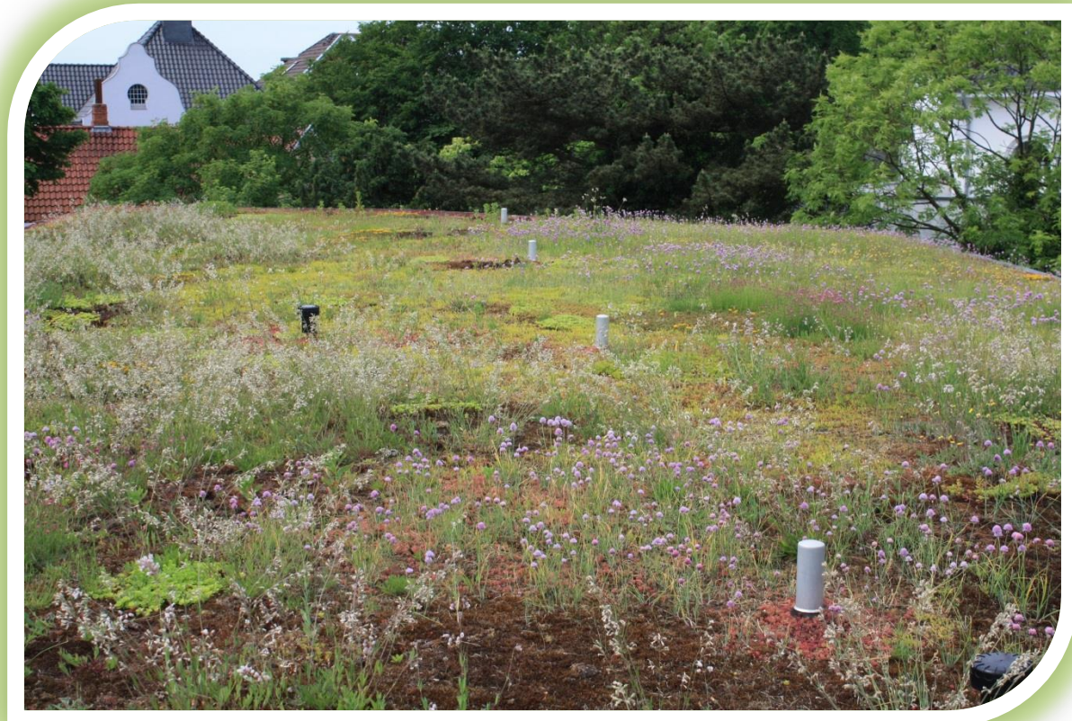
Dachbegrünung auf Stadthaus 2 der Stadt Osnabrück