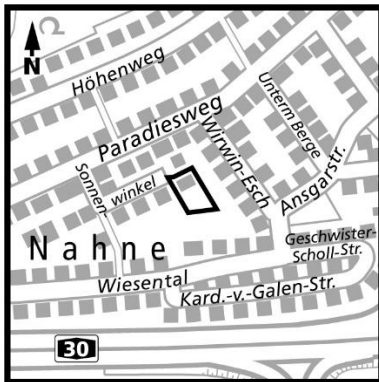
1a.) B-Plan Nr. 276, 7. Änder.

Die Planbereiche sind in den untenstehenden Planausschnitten dargestellt.