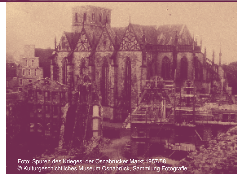
Foto: Spuren des Krieges: der Osnabrücker Markt 1957/58.

Ende 2011 wurde die neu konzipierte Gedenkstätte Esterwegen eröffnet. Sie erinnert an die Emslandlager, die insbesondere in der Frühphase des Nationalsozialismus eine zentrale Rolle bei der Ausschaltung der politischen Opposition spielten. Zu den prominentesten Insassen gehörte Carl von Ossietzky. Zwischen 1933 und 1945 waren in den 15 Konzentrations-, Straf- und Kriegsgefangenenlagern etwa 200.000 Menschen inhaftiert. Von ihnen kamen ca. 25.000 ums Leben. Neben den unterschiedlichen Bezügen dieses Lagersystems zur Stadt Osnabrück wird das aktuelle Konzept der Gedenkstätte Esterwegen präsentiert.