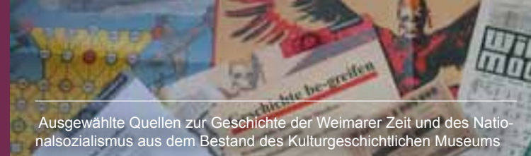
Ausgewählte Quellen zur Geschichte der Weimarer Zeit und des Nationalsozialismus aus dem Bestand des Kulturgeschichtlichen Museums

Im „Haus der Erinnerung“ (Villa Schlikker) treffen sich einmal monatlich Zeitzeuginnen und Zeitzeugen im Arbeitskreis „Zeitgeschichte“, um unter wissenschaftlicher Anleitung ihre Erinnerungen zu Nationalsozialismus, Zweitem Weltkrieg und Nachkriegszeit aufzuarbeiten. Die Ergebnisse des Oral History-Projektes werden für das Museum dokumentiert. Die aktuellen Termine werden über die örtliche Presse und das Internet angekündigt. www.osnabrueck.de/zeitzeugen