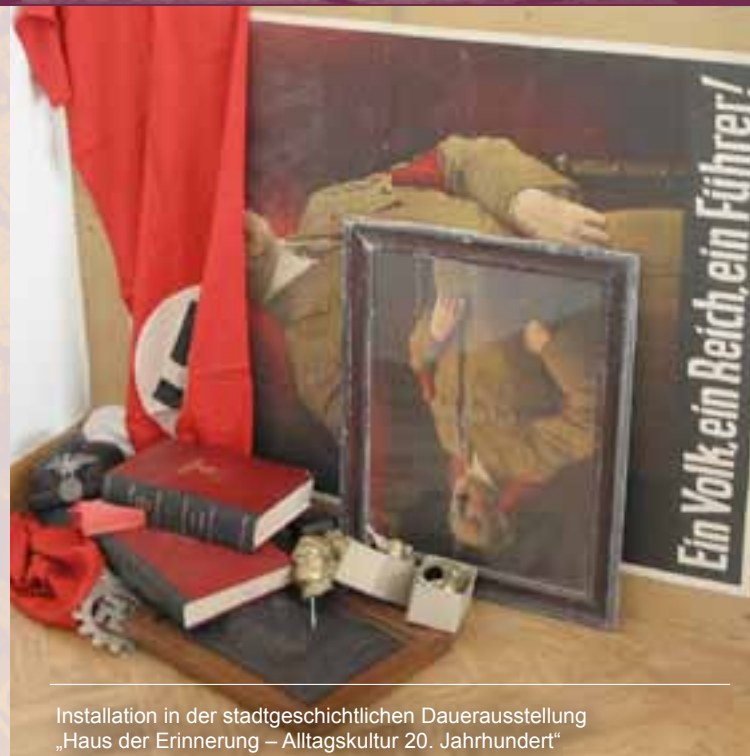
Installation in der stadthistorischen Dauerausstellung „Haus der Erinnerung – Alltagskultur 20. Jahrhundert“

Das Kulturgeschichtliche Museum möchte mit seiner Vortragsreihe „Topografien des Terrors – Nationalsozialismus vor Ort“ zur Auseinandersetzung mit der NS-Ideologie und ihrer Zeit anregen. Veranstaltungsort ist mit der Villa Schlikker die einstige Osnabrücker NSDAP-Zentrale. Als Museum für die Osnabrücker Geschichte des 20. Jahrhunderts ist die Villa heute zentrales Forum einer kontinuierlichen Erinnerungsarbeit zur NS-Geschichte. Im Jahr 2012 geht es um aktuelle Formen des Erinnerns und Gedenkens an die Geschichte des Nationalsozialismus in und um Osnabrück.