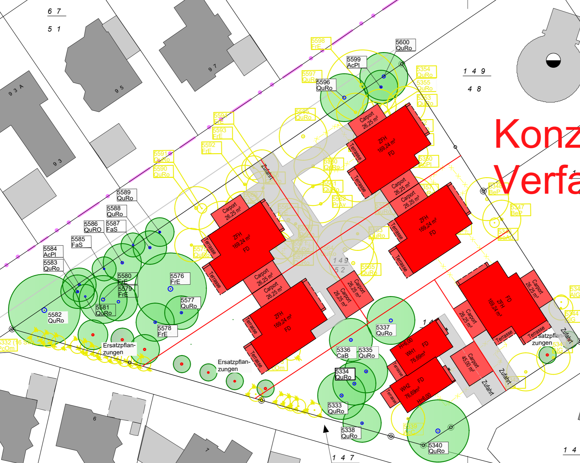
Lageplan V2 M. 1:500 02.06.2020 (070-19)