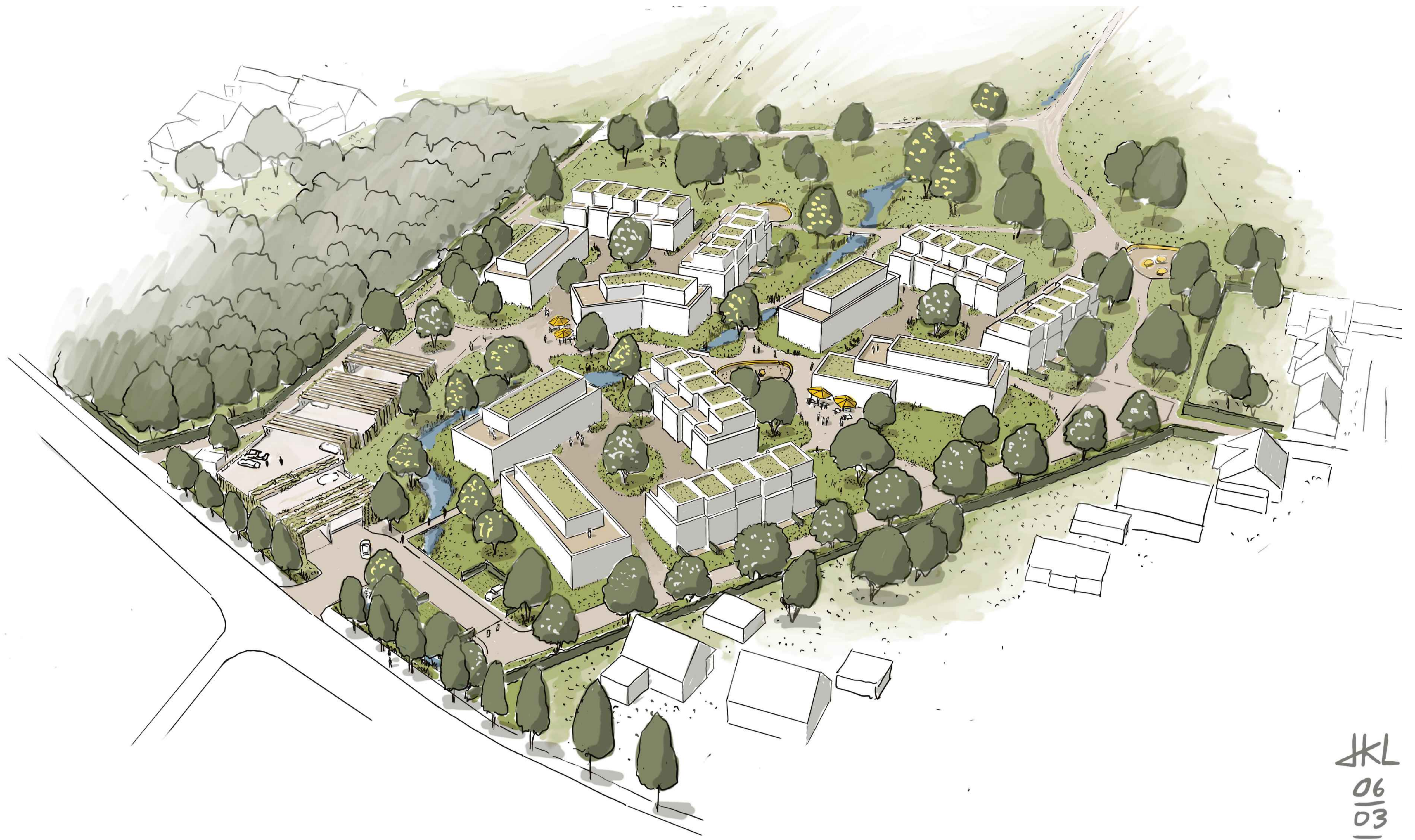
Perspektive des Quartiers